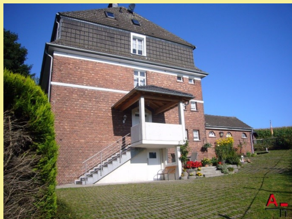
Beratung des Interessenten beim Immobilienkauf

Architekten, warum? Häufig stellt sich der Bauherr die Frage, ob zum bestehenden Bauvorhaben ein Architekt herangezogen werden sollte? Macht es Sinn, einen Architekten zu beauftragen? Begleitet von weiteren Fragen, was der Architekt macht, was er kostet und in wie fern er das Bauvorhaben unterstützt? Grundsätzlich kann Ihnen ein Architekt bei Um-, An-, Aus-, oder Neubauten zur Seite stehen und dabei helfen, Ihre Wünsche zu realisieren. Architekten machen sowohl bei kleinen Bauvorhaben Sinn, wie beispielsweise einem Ausbau eines Dachgeschosses, als auch bei größeren Projekten, wie der Neubau eines Hauses oder Sanierungs- und Umnutzungsmaßnahmen von bestehenden Gebäuden. Vom Entwurf, über die Einholung von Genehmigungen, die Beauftragung von Fachfirmen bis hin zur Überwachung des Bauvorhabens und des Budgets, schafft der Architekt sich eine Gesamtübersicht des Bauvorhabens und kann gezielt Vorgänge steuern und kontrollieren.