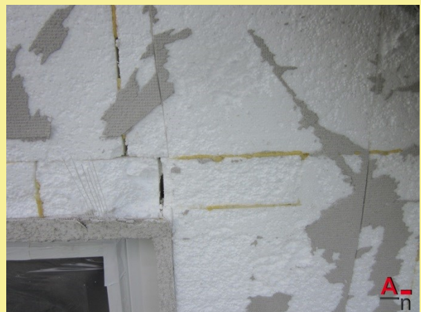
Mangelhafte Herstellung des Wärmedämmverbundsystems