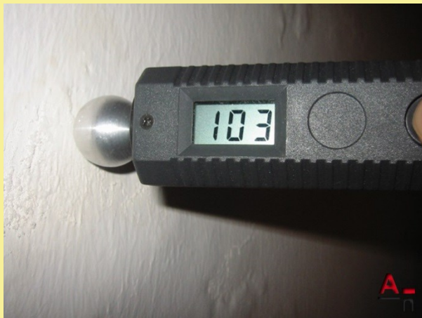
Messung im Kellergeschoss auf Feuchtigkeit