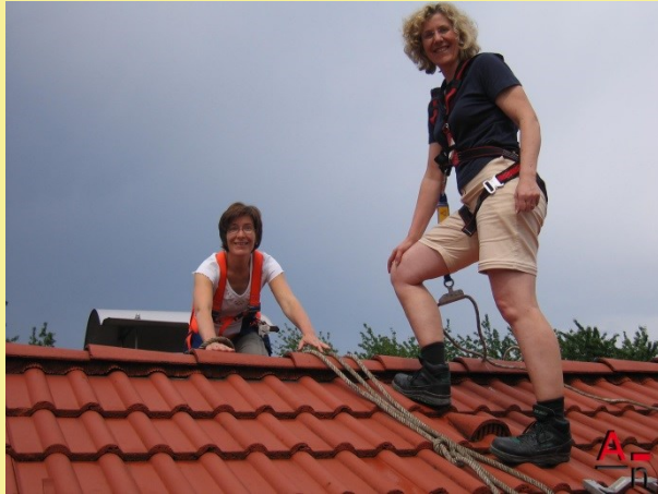
Intensive Begutachtung des Daches