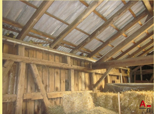
Umnutzung, Umbau einer alten Scheune zum Wohnhaus